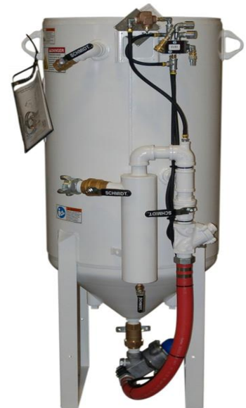
(20 ft 3 )

EL PUNTO FINAL EN LA EXCELENTE PRESENTACIÓN DE SUS PRODUCTOS EN LATINOAMÉRICA Y EL CARIBE