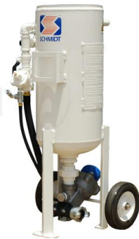
MINI (0.9 ft 3 )

Con las características generales descritas y capacidad de tolvas de 3.5, 6.5, 10 & 20 pies cúbicos