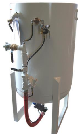
(10 ft 3 )