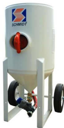
(6.5 ft 3 )