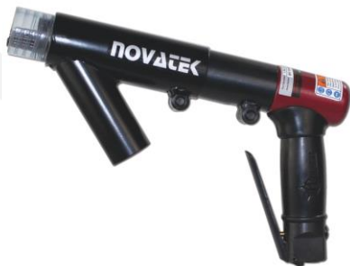
Escariadores de Agujas con Sistema de Vacío