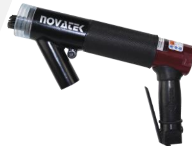
Escariador de Agujas con Sistema de Vacío y sistema VRS