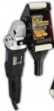
Escariadores Rotopeen Eléctrico