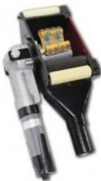
Escariadores Rotopeen Neumático