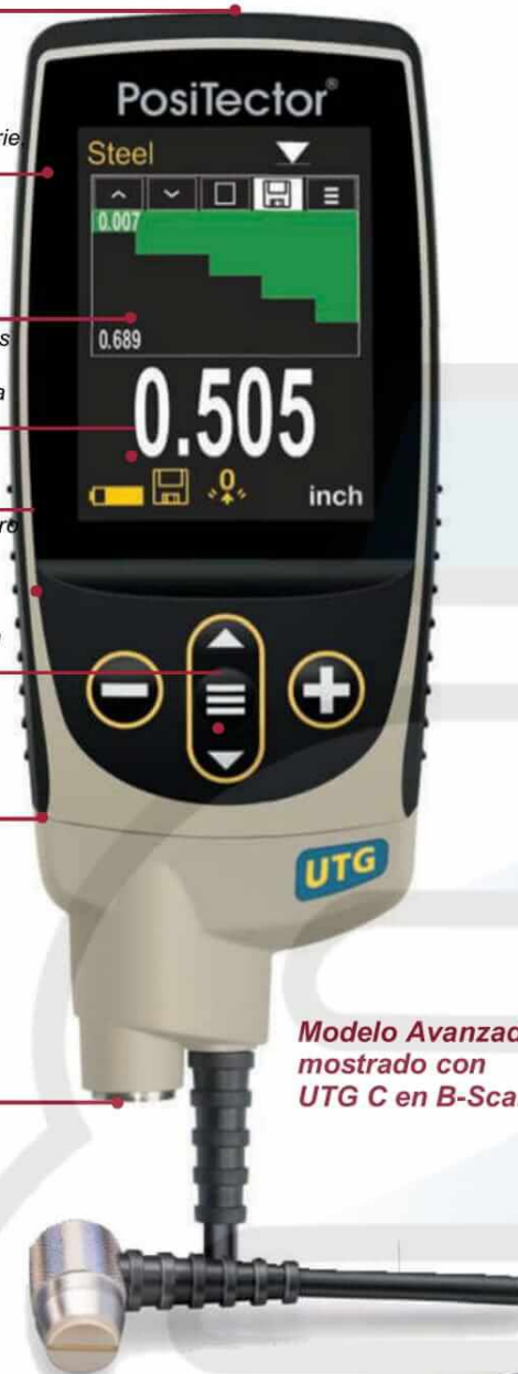
Modelo Avanzado mostrado con UTG C en B-Scan

Todos los medidores se entregan con gel ultrasónico, funda protectora de caucho, correa para la muñeca, 3 pilas alcalinas AAA, instrucciones, pantalla protectora para lentes, estuche de transporte de nylon con correa para el hombro, certificado de calibración NIST, cable USB, software PosiSoft, dos (2) años de garantía en el cuerpo y la sonda.