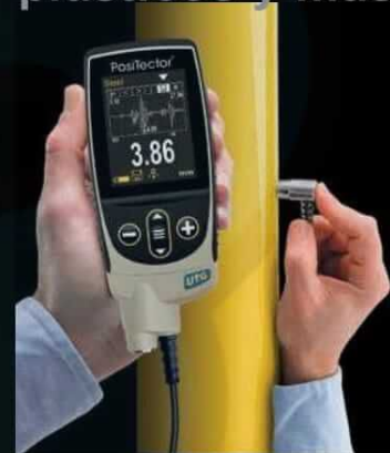
UTG M modelo Thru-Paint

Medición de espesor de pared de materiales como acero, plásticos y más