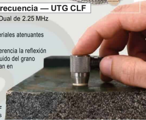
UTG CLF Para fundiciones