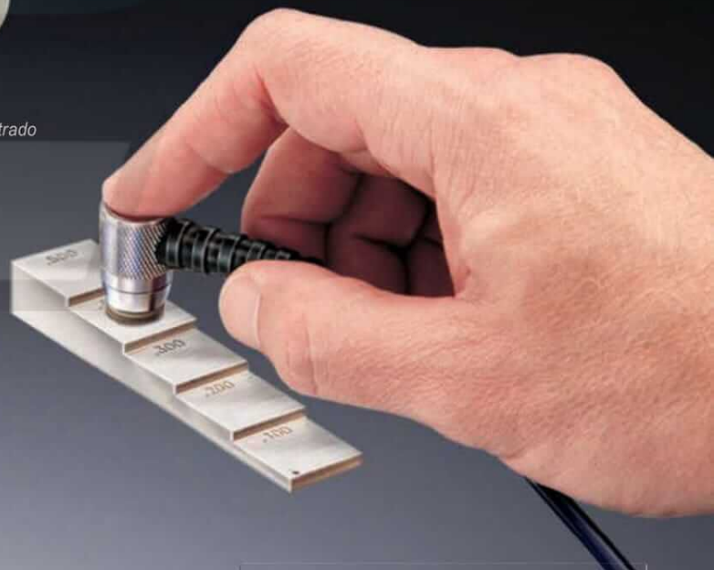
UTG C mostrado con Block Certificado opcional

Medición del espesor del metal de una estructura pintada sin remover el recubrimiento.