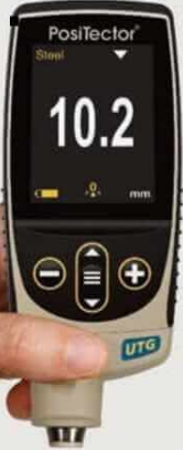
UTG CA Para operación con una mano

Mide el espesor de la pared del material como acero plástico y más. Ideal para medir los efectos de la corrosión o erosión en tanques, tuberías o cualquier estructura donde el acceso es limitado.