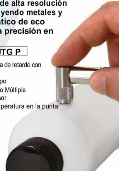
UTG P Para alta resolución y materiales delgados