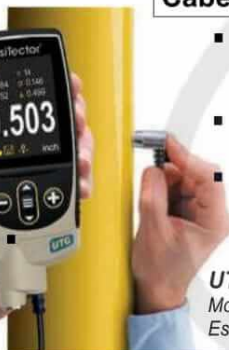
UTG M1 Modelos Estándar

Capacidad de Thru-Paint para medir de forma rápida y precisa el espesor de pared del metal de una estructura pintada sin remover el recubrimiento. También es ideal para medir materiales granallados y otras aplicaciones que requieren una cara de contacto resistente al desgaste