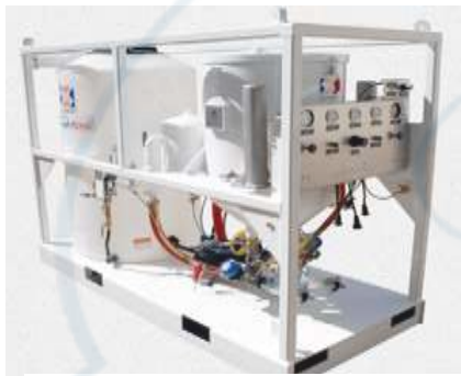
AmphiBlast (Dos salidas)

Tolva – 4,5 cu.ft. Tanque Agua 80 galones. (58" x 38" x 56"). Peso: 850 lb.