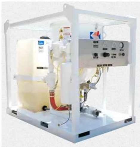
AmphiBlast (Una salida)

Tolva – 4,5 cu.ft. Tanque Agua 80 galones. (58" x 38" x 56"). Peso: 850 lb.