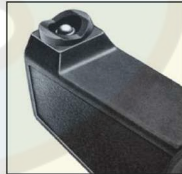
Sonda de medición de carburo para una larga vida útil.