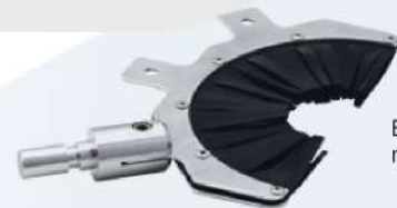
Electrodo de cepillo de neopreno de medio círculo