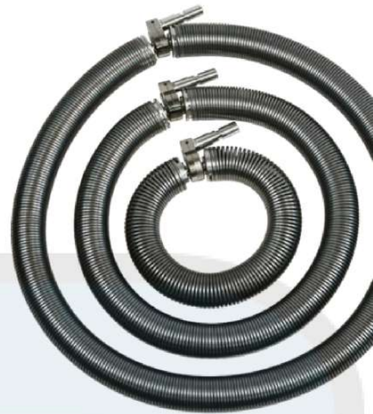
Electrodos de resorte rodantes

Para obtener una lista completa de electrodos disponibles, visite www.defelsko.com/hhd